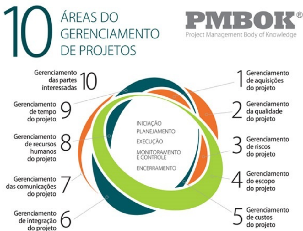
Figura 2: Áreas do Gerenciamento de Projetos

O conhecimento em gerenciamento de projetos é composto por dez áreas específicas dentro das diversas fases do ciclo de vida de um projeto, apresentado na figura 2: